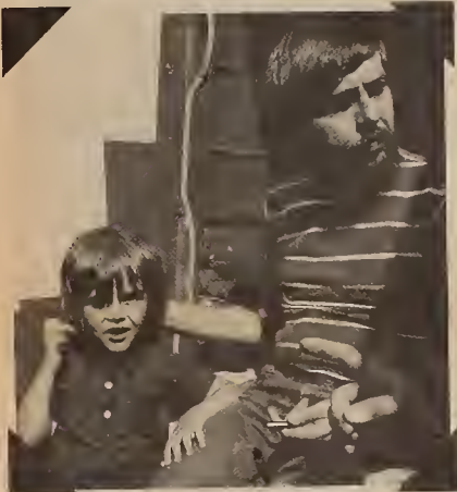
Moroz Hunger Strike