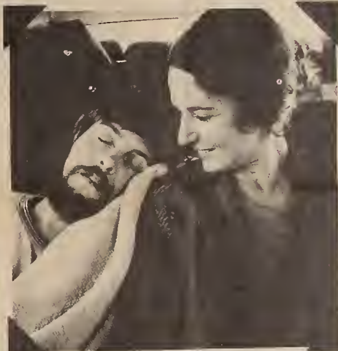
En route to the Winnipeg SUSK Congress, 1974