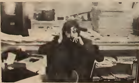
SUSK Office, Toronto, 1971.