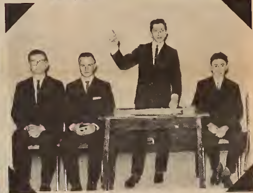
Debating Club, Yorkton Collegiate, Winnipeg, 1961