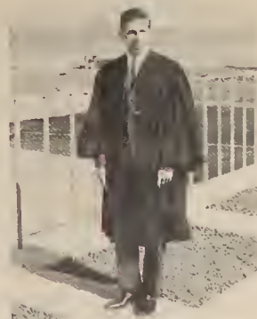
Yorkton Collegiate, Winnipeg, 1963

Роман Купчинський. Президент "Прологу", і доволітний діяч в Комітеті Оборони Радянських Політичних В'язнів, Нью-Йорк.