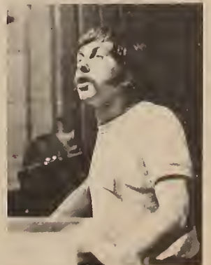
SUSK, Thunder Bay, 1971