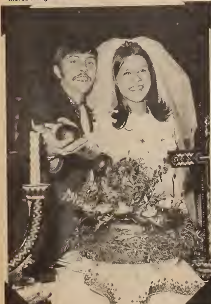
Winnipeg, March 1970