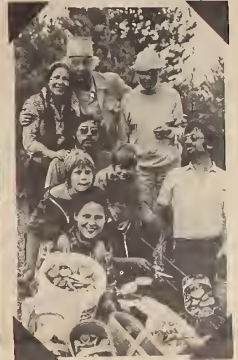
Toronto, October 1982