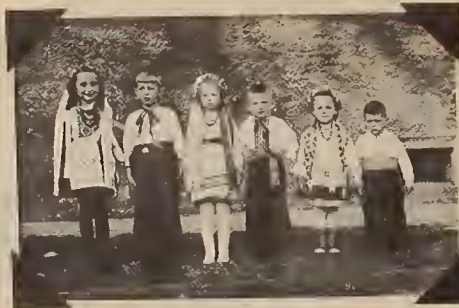
Mittenwald, Germany, 1950