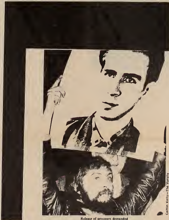
Release of prisoners demanded