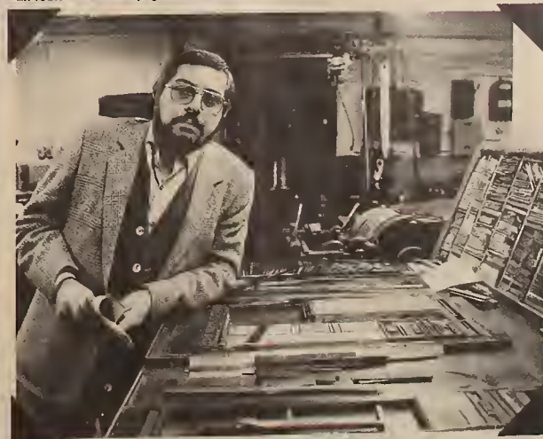
Ukrainian Echo, Toronto, 1983.